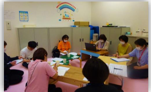
《 勉強会の様子 》

今後も市内事業所様との連携を深めていきたいと考えていますので、ご提案等ございましたらよろしくお願いいたします。