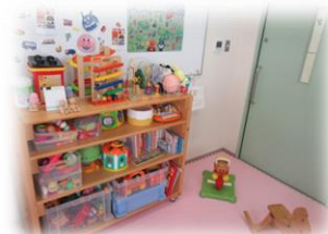
《 第2療育センター 託児室 》

※詳細につきましては、下記センターまでお問合せください。見学もお待ちしています。