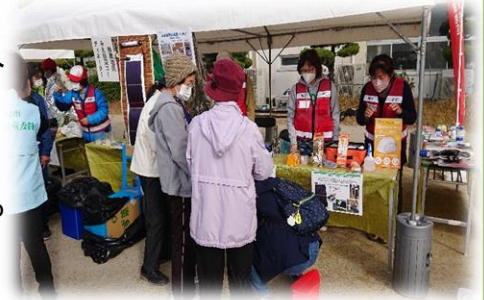
↑ノ宮地区地震防災訓練の様子