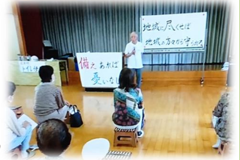
↑南畑サロン防災勉強会の様子