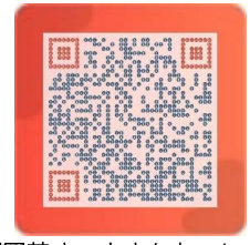
劇団花さつきさんホームページ