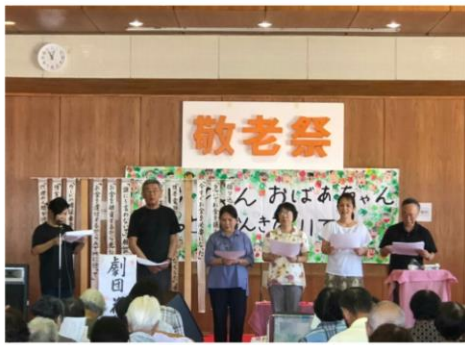
オレオレ詐欺の啓発