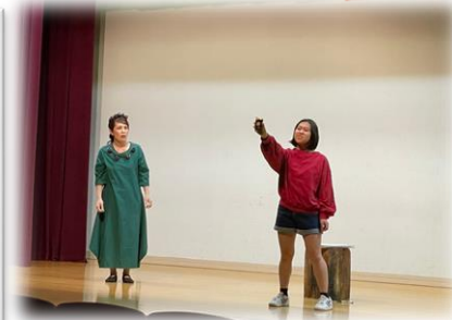
「お地蔵さまの大松」トライアル公演 YouTubeは下記のQRコードから ご覧ください