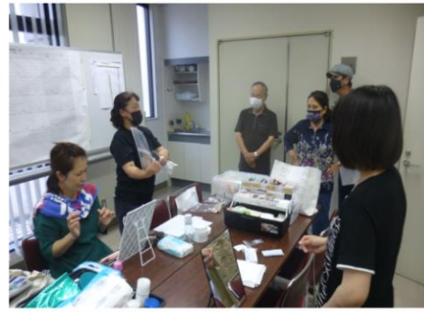
演劇ワークショップ