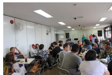
病気で仕事ができない方のため、チャリティ食事会&ピンゴ