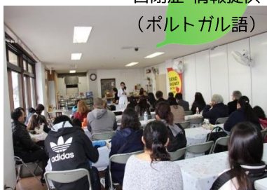
自閉症 情報提供 (ポルトガル語)